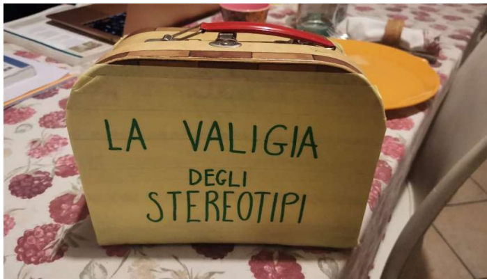
La valigia utilizzata per il lavoro di decostruzione degli stereotipi