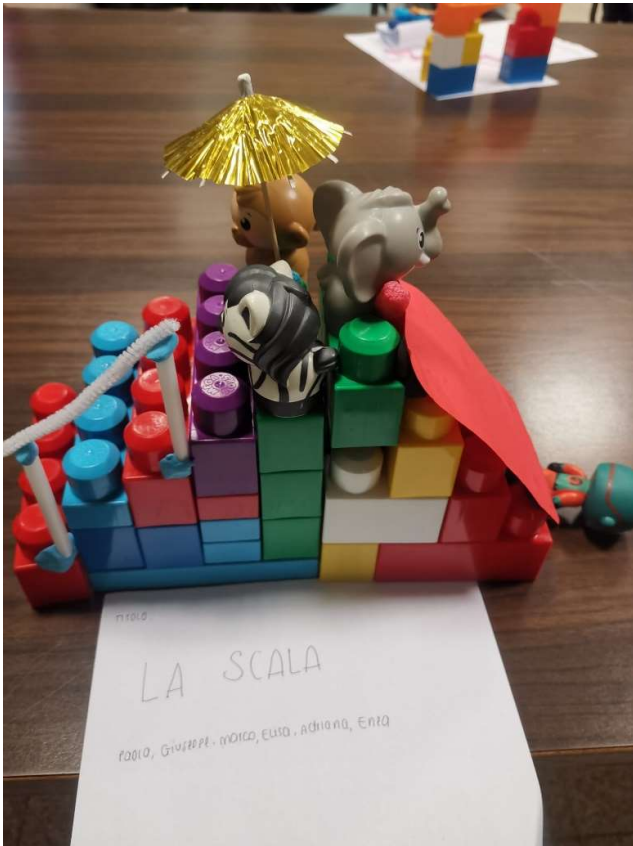
Alcuni atti creativi che rappresentano il gender gap